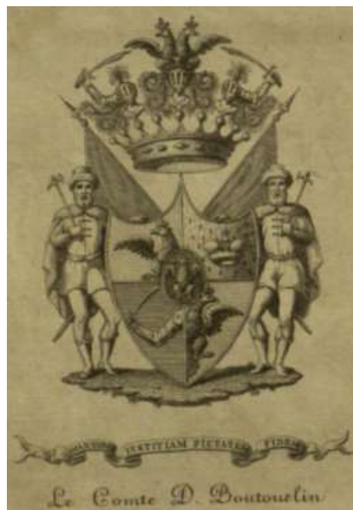
Рис. 1. Экслибрис Д.П. Бутурлина