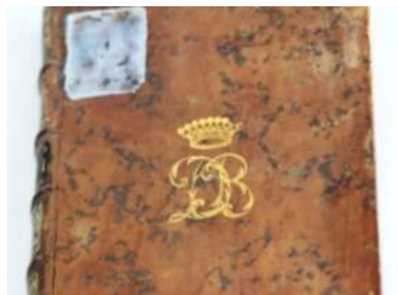
Рис. 3. Суперэкслибрис Д.П. Бутурлина